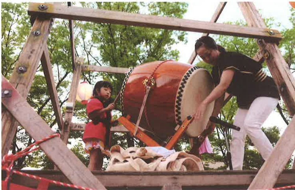
写真のタイトル「ドンドンドン!可愛いな!」 撮影地：小中島公園