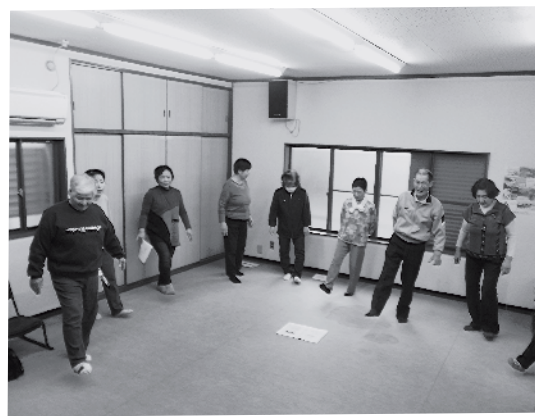
転倒予防講習会の様子

と次回も決まり、これからも、お互いの助け合いが出来るように居場所づくりが出来たらと思います。