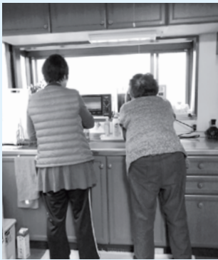
利用者さんと共に

こに言えば助けてくれる、一緒に支えてくれる場です。10月末現在、すでに33件の活動依頼が入っており、少しずつ活動の輪が広がっています。