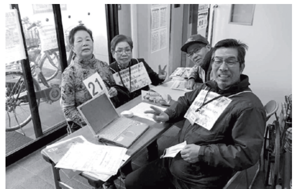
園田支部 出資コーナー

診療所待合室などでの組合員による出資コーナーが広まり始めています。診療所やデイサービスを利用している方で未加入の方には加入にもつながればと思っています。