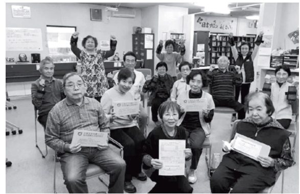
小中島支部 いきいき百歳体操