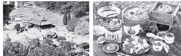
松茸御飯食べ放題・松茸のスキヤキ・松茸のポン酢掛け松茸の茶碗蒸し・松茸の土瓶蒸し・岡山ぶどう・香の物