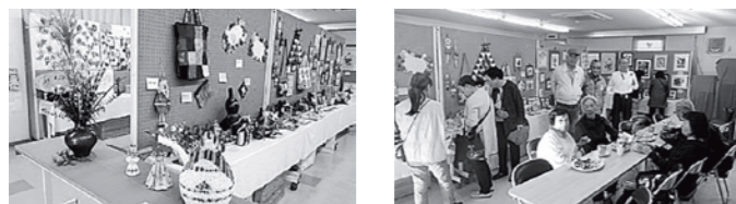
昨年の文化祭の様子

そろそろ秋の文化祭ですが今年は中止になりました。家での自粛で作品を作られたと思い、望んでいましたが残念です。来年に期待したいと思います。