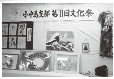
11/3、4 小中島支部 文化祭