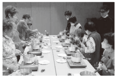
10/16 長洲支部バスツアー