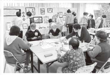
11/8、9 常光寺支部 文化祭