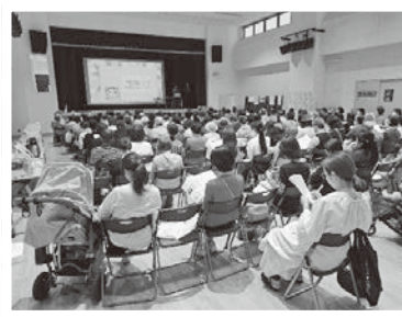
10/11 季節の食養生 (漢方・鍼灸、コープ自然派兵庫)