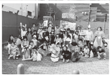
10/27 親子ハロウィン善法寺歩き