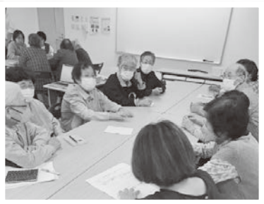
9/30、10/29、11/19 わくわく健康まつりミーティング