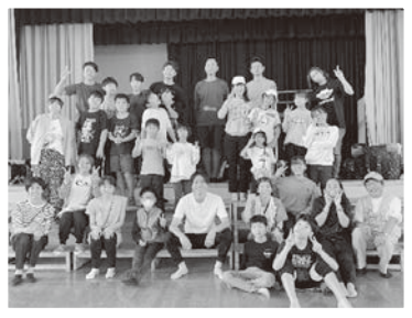
10/12、13 小園小学校キャンプ (おぞの探検隊)