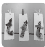
武家むすめ 人形しおり