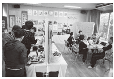
11/9、10 善法寺支部 作品展