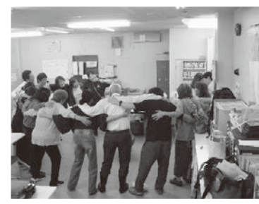
10/19 根っこの会職員交流会 (阪神医療生協、愛逢、阪神共同福祉会)