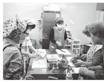
11/11 薬膳カレー作り (小中島支部)