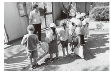
10/10 小園小2年生 まち探検