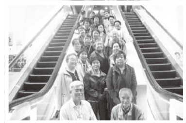
11/15 小中島支部バスツアー