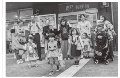
10/22 子ネットハロウィン