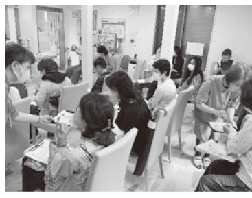
9/30、10/21 薬膳を学んで健やかな体作り (漢方)