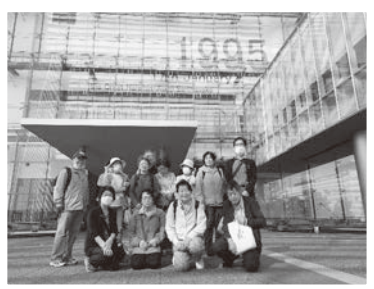
10/30 防災ウォーキング (環境人権委員会)