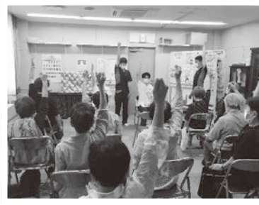
10/18 リハビリ学習会 (長洲支部)