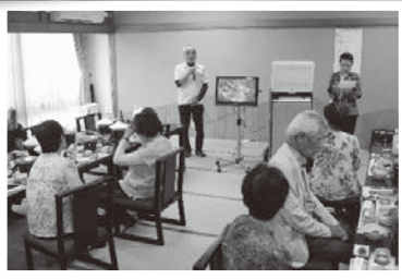
9/27 善法寺支部バスツアー