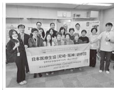
10/29 with 医療福祉社会的協同組合 (韓国) 訪問