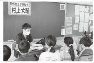
9/25 園田南小6年生 キャリア教育