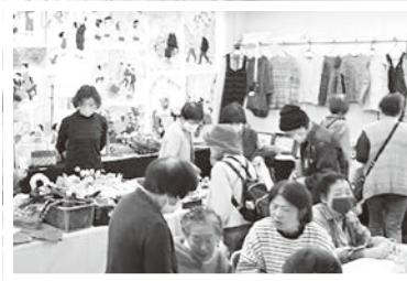
11/14、15 長洲支部 作品展