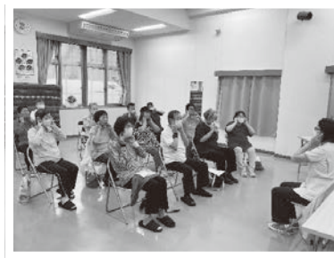
10/18 鍼灸講座 (神崎スマイルひろば)