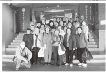
11/13 わかくさ支部バスツアー