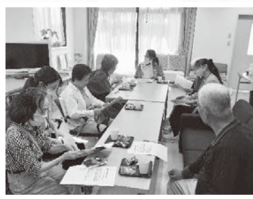
10/9 おしゃべり広場 (ケアサポートセンター第三)